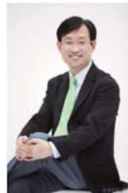
◀ 김상현 네이버 대표