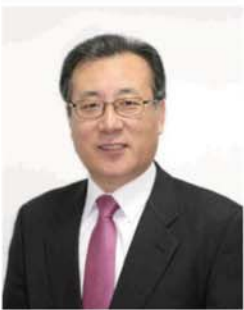
◀ 한정화 중소기업 청장