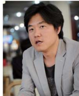
▲ 나영석 PD

시간 : 14:30 ~ 15:50 장소 : 인터불고호텔 엑스코 그랜드볼룸 주제 : 문화와 경영의 만남 “꽃보다 할배” 나영석 PD 유필화 성균관대 교수