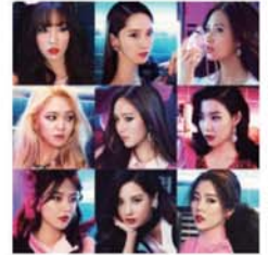
▲ 소녀시대 공연

시간 : 20:00 ~ 21:30 장소 : 인터불고호텔 엑스코 그랜드볼룸 축하공연 : SM엔터테인먼트, CJ E&M 주관