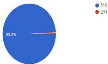
2. 학회(사단법인) 대표자 변경 건